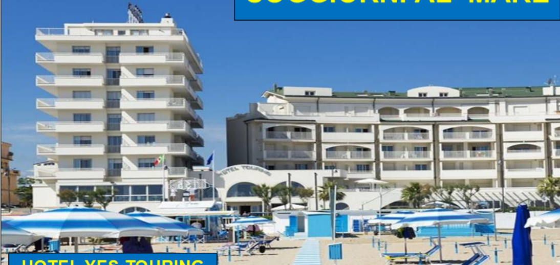
HOTEL YES TOURING