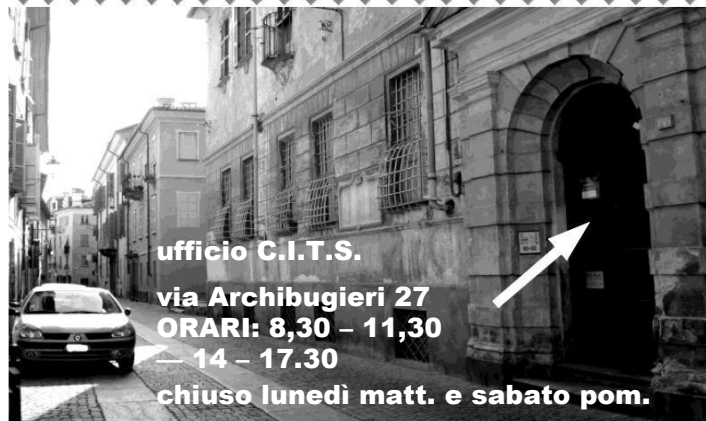
ufficio C.I.T.S. via Archibugieri 27 ORARI: 8,30 – 11,30 – 14 – 17,30 chiuso lunedì matt. e sabato pom.