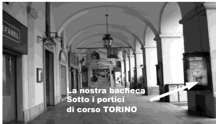
La nostra bacheca Sotto i portici di corso TORINO